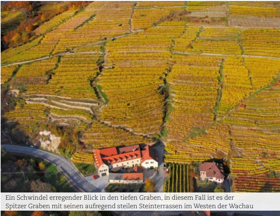
Ein Schwindel erregender Blick in den tiefen Graben, in diesem Fall ist es der Spitzer Graben mit seinen aufregend steilen Steinterrassen im Westen der Wachau